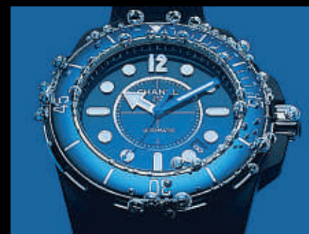
CHANEL J12 MARINE

E s la feria más importante del sector de la relojería y muestra las tendencias de las grandes marcas, obstinadas en reafirmar los brotes verdes que apuntan a una salida de la crisis. Rolex, fantástico, novedades ligadas al mundo de la telefonía que revolucionarán el futuro ●