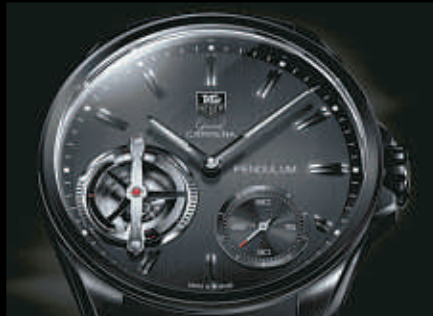
TAG HEUER PENDULUM