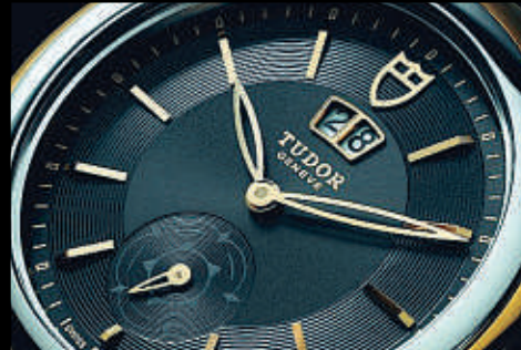
TUDOR GLAMOUR DOUBLE DATE