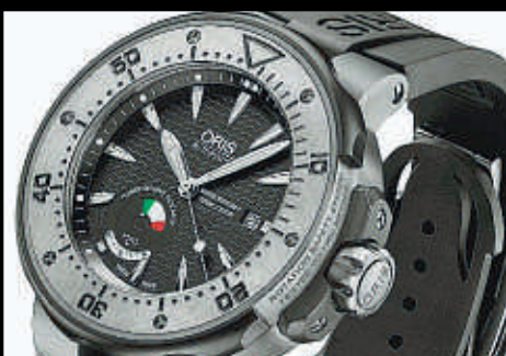
ORIS EDICION LIMITADA