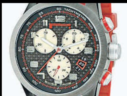
PIRELLI PZERO CRONO ALL BLACK