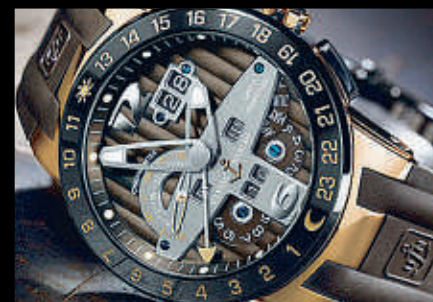
ULYSSE NARDIN EL TORO